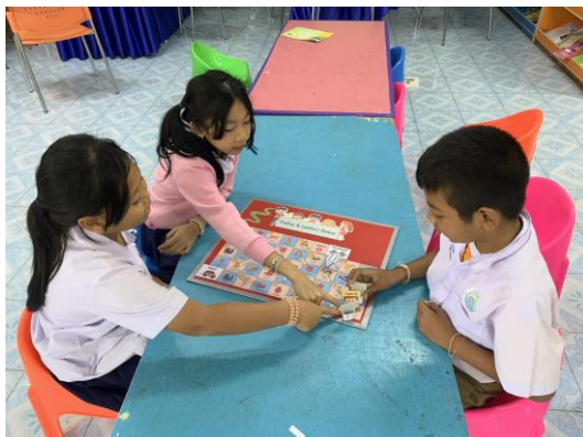
ภาพที่ 1 การจัดการเรียนการสอนการออกเสียงพยัญชนะท้ายคำภาษาอังกฤษตัว ‘T’ โดยใช้เกมบันไดงู

จากภาพที่ 1 พบว่า การจัดการเรียนการสอนการออกเสียงพยัญชนะท้ายคำภาษาอังกฤษตัว ‘T’ โดยใช้เกมบันไดงู นักเรียนมีความสนใจในการออกเสียงพยัญชนะท้ายคำภาษาอังกฤษตัว ‘T’ มากขึ้น เนื่องจากเกมมีกติกาการเล่นจึงเกิดความท้าทาย ทำให้นักเรียนได้ฝึกออกเสียงพยัญชนะท้ายคำภาษาอังกฤษตัว ‘T’ ที่เรียนมาด้วยความสนุกสนานจนเกิดความชำนาญ สามารถจดจำคำศัพท์และวิธีการออกเสียงได้อย่างดี รวมถึงบรรยากาศในห้องเรียนมีความน่าตื่นเต้นมากยิ่งขึ้น โดยมีคุณครูคอยช่วยเหลือและให้คำแนะนำ